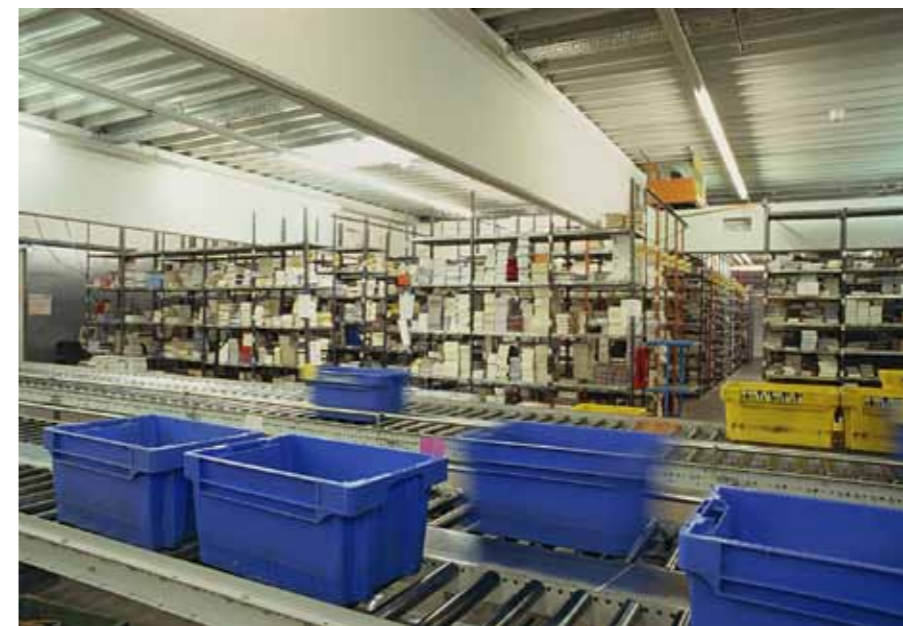
Förderband Warenversand: Optimale Kommissionierstrategien erschließen zahlreiche Optimierungspotenziale.

Eine weitere Optimierungsmöglichkeit bietet die komprimierte Auftragskommissionierung in einem separaten Bereich. Statt der klassischen ABC-Klassifizierung lässt sich mit dem Lager- und Flächenmanagement des PSIlwms dafür ein auftragsbezogenes Artikellager, der Expressbereich, einrichten. Ziel ist es, dort bei geringer Artikelanzahl und optimaler Bestandshaltung möglichst viele Aufträge in möglichst kurzer Zeit komplett zu kommissionieren. Als Bypass des normalen Kommissionierbereichs erzielt ein solcher Expressbereich erhebliche Entlassungseffekte. Die entsprechenden Herausforderungen an Effizienz und Verfügbarkeit löst PSIlwms mit komplexen Optimierungsmethoden.