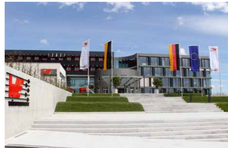
Zehn Millionen Euro investierte Würth Elektronik 2012 in den modernen Erweiterungsbau am Standort Waldenburg.

10.000 Artikelstämme sind im Distributionszentrum Waldenburg zu verwalten. 5.000 Palettenstellplätze stehen im Hochregallager (HRL), weitere 30.000