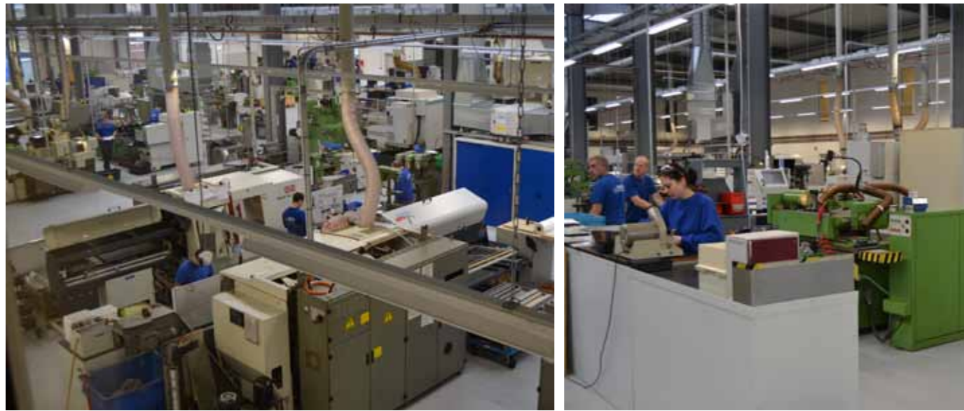
Frisch- und Abwassersysteme werden bei GLS auf Kundenwunsch oder in Eigenentwicklung gefertigt.