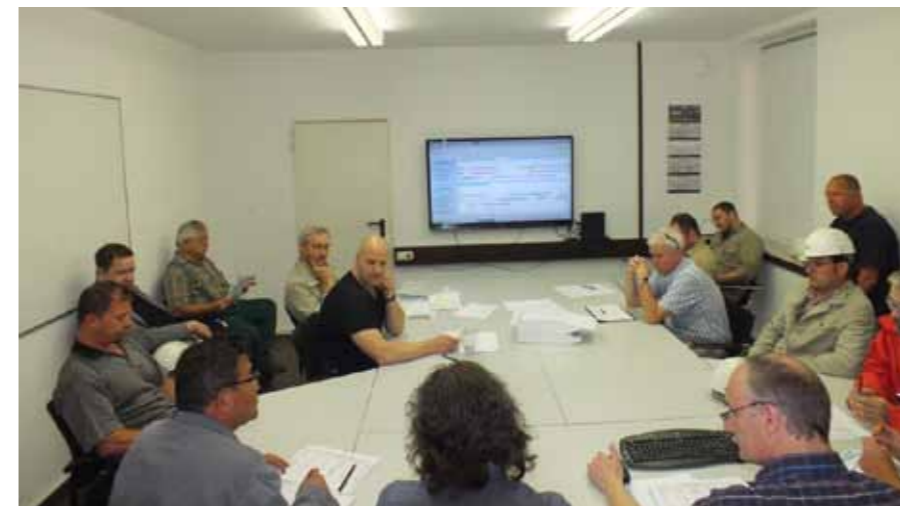
Effiziente Kommunikation mit dem neuen System: Freitagbesprechung zwischen Werksleitung, Arbeitsvorbereitung, Fertigungssteuerung, Abteilungsleitern und Meistern.

lohnt sich aber angesichts der nachhaltigen Einsparungen in der Energieversorgung auf jeden Fall.