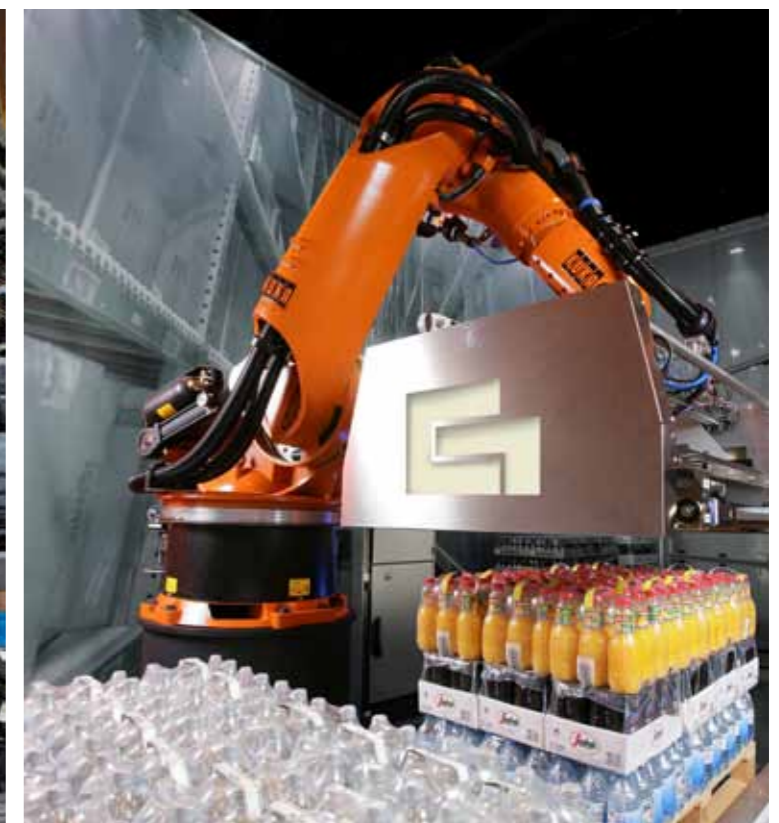
Im Bereich der Intralogistik werden mit Grenzebach Robotic Gepäckstücke automatisch verladen (Bild 1) sowie Paletten optimal be- und entladen (Bild 2).