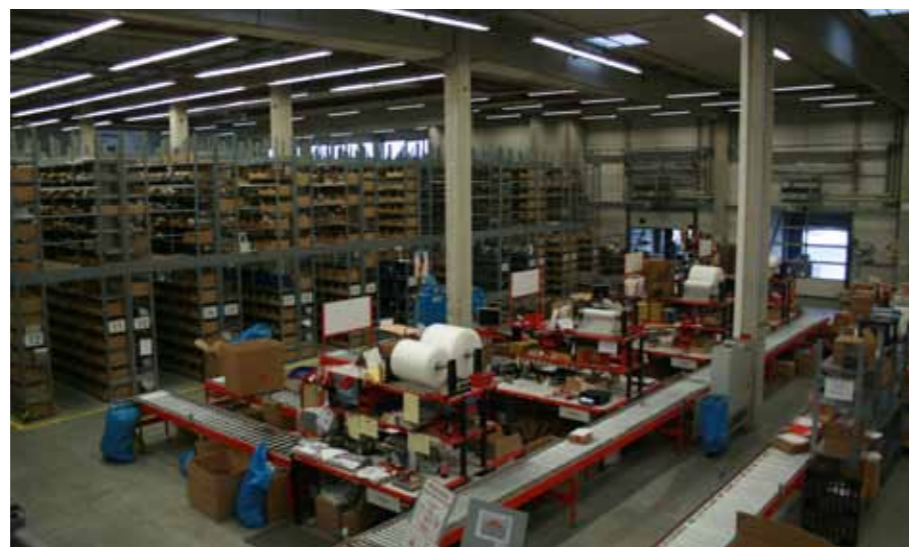
Nach sukzessiver Bestandserfassung in PSIwms erfolgt die weitere Automation.

PSI Logistics bietet eine Version des PSIwms, die sich nach einer Schulung von den Anwendern eigenständig auf ihre Anforderungen hin zuschneiden lässt. So können Anwender der Version ohne nennenswerten Programmieraufwand selbständig etwa auf die Integration neuer Mandanten, Veränderungen von Topologien, Einlagerungs- und Kommissionierstrategien im Lager oder die Einbindung eines Staplerleitsystems ausrichten. Die Lagerbetreiber nehmen Zuordnungen von Anwendungen, Lagerorten, Produktionswerken und Buchungsgründen selbst vor und richten Statistikfunktionen oder die Schnittstellen zum Warenwirtschaftssystem selbst ein und administrieren sie. Dabei lassen sich unter anderem die Datensätze der Mandanten jederzeit