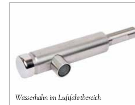
Wasserhahn im Luftfahrtbereich

schrieben habe. Ich kannte also die Firma, viele Mitarbeiter und das Arbeiten des Unternehmens. Und ich war sowohl von den Prozessen als auch von dem Produkt überzeugt. Dennoch war ich skeptisch, ob PSIPenta das richtige System für uns wäre. Denn die Lösung bringt eine Vielzahl von Funktionen mit, die mir für die Größe meines Unternehmens „oversized“ erschienen. Andererseits lockte die Tatsache, dass PSIPenta viele Funktionen im Standard abdeckt, was nicht nur kostenseitig von Vorteil ist. Letzten Endes wurde uns auch als eher kleinem Kunden eine wirtschaftliche Lösung angeboten. Heute sind wir froh, ein Sys-