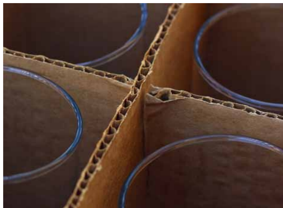
Die optimale Versandverpackung reduziert die Kartonage- und Versandkosten.

gung der gegebenen Randbedingungen erfolgt dazu eine optimale Zuordnung der Artikel in Schnell- beziehungsweise Langsamdreher-Bereiche. Anwender des PSIlwms legen mit dem Lager- und Flächenmanagement ein optimiertes Lagerlayout an. Anhand dieses Layouts werden die Prozesse analysiert und ihre Standardzeiten ermittelt. Anschließend erfolgt die Optimierung der Pickprozesse: Mit komplexen Optimierungsalgorithmen minimiert PSIlwms dabei den Gesamtaufwand für Nachschub, Pickprozesse und Umlagerungen. Um Verwechslungen bei der Kommissionierung zu vermeiden, berücksichtigt PSIlwms unter anderem eine räumlich getrennte Lagerung von Produkten mit