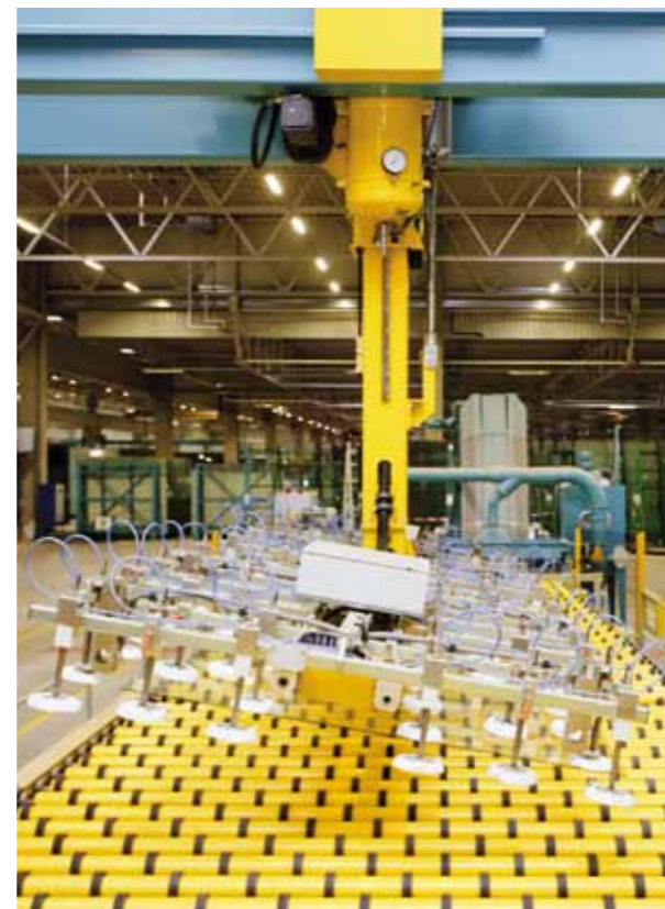
Prozessgesteuerte Materialfluss- und Handlingsanlagen in der Flachglasindustrie ermöglichen höchste Präzision und Laufruhe bei Produktion, Verarbeitung sowie Transport von Glas und machen Grenzebach zu einem richtungsweisenden Unternehmen.