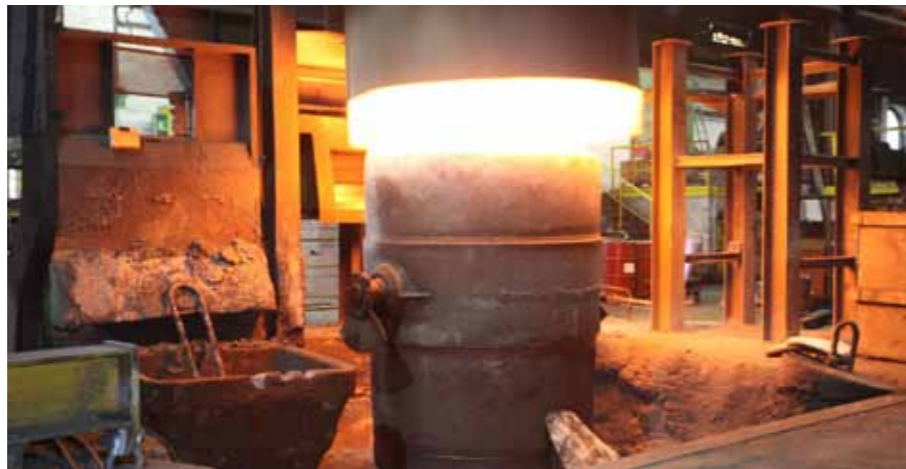
Magnesiumbehandlung mit Tauchpfanne und Tauchglocke unter effizienter Nutzung der Pfannenrestwärme aus vorherigem Prozess.

Angesichts der anhaltenden Energiepreis-Diskussion und den Herausforderungen im Zusammenhang mit der Energiewende müssen gerade energieintensive Produktionsbetriebe ihre Verbräuche optimieren. Das Bundesministerium für Umwelt, Naturschutz und Reaktorsicherheit (BMU) hat daher unter dem Motto Best for Production ein Projekt gefördert, das Modellcharakter für eine energieoptimale Produktion in Großgießereien hat und zukunftsweisend ist im Sinne einer Green IT.