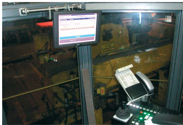
Kranterminaldialog mit Darstellung von Fahraufträgen, IST- und SOLL-Positionen sowie Stapelinformationen

weiteren Behandlung oder bis zum Versand zwischengelagert werden. Eine Besonderheit bei Blechlagerung ist dabei die Lagerstruktur ohne feste Reihen und Plätze.