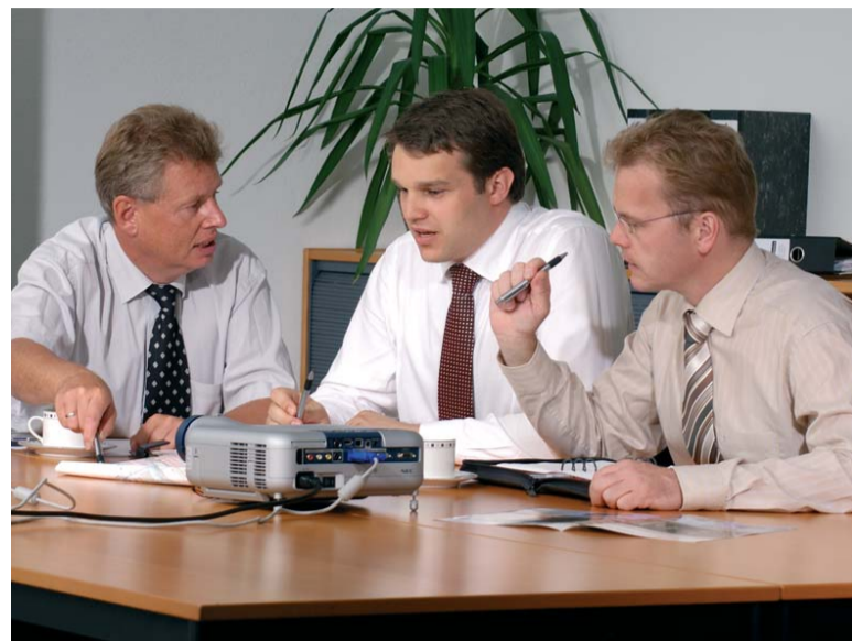
Teamarbeit ist beim Einsatz iterativer Projektabwicklung unabdingbar.

lisierung, Integration und Einführung – definiert sind, auf einander aufbauen und nacheinander abgearbeitet werden, ermöglicht das iterative Vorgehen eine flexible Einbindung des Prozesscharakters eines Projektes. Projekte werden in überschaubare, eigenständige Teilprojekte gegliedert. So können frühzeitig funktionsfähige Teilprodukte ausgeliefert, Anpassungen sequenziell umgesetzt und mehrfach durchlaufen werden. Mit den Durchläufen erfolgt eine iterative Verfeinerung der einzelnen Softwarekomponenten beziehungsweise ihrer Funktionsumfänge. Vorteil: Die bei dynamischen Abfolgen üblichen, vorab nicht planbaren Erkenntnisse und Neuerungen, die sich erst im Ablauf eines Projektes ergeben, lassen sich sofort in die Systementwicklung einbinden und in ihren Auswirkungen auf das Gesamtsystem überprüfen. Umfassende Gesamtlösungen entstehen schließlich durch den