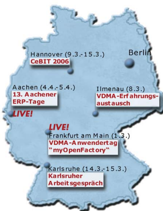
Fünf Wochen im Frühjahr '06 - "myOpenFactory-Roadshow"

grierte Verbindungen zu Lieferanten oder anderen Wertschöpfungspartnern. Durch Standardisierung des Datenaustauschs und Integration der Prozesse können aber Produktionsnetze entstehen, die künftig zum Alleinstellungsmerkmal dieser Branche, der Kooperationsgemeinschaft und den Fertigungsstandort Deutschland erwachsen. Demzufolge muss die Kommunikation unter den verschiedenen ERP-Systemen durch Standards unterstützt werden, um so eine einfache Möglichkeit zur überbetrieblichen Auftragsabwicklung zu schaf-