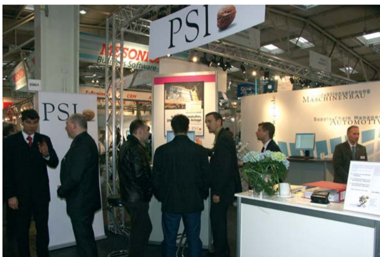
CeBIT 2005: Die PSI auf dem FIR-Gemeinschaftsstand

In der Kuppelproduktion entstehen in einem Arbeitsgang mehrere unterschiedliche Erzeugnis-