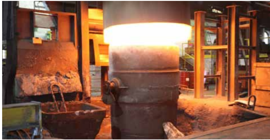
Magnesiumbehandlung mit Tauchpfanne und Tauchglocke unter effizienter Nutzung der Pfannenrestwärme aus vorherigem Prozess.

Angesichts der anhaltenden Energiepreis-Diskussion und den Herausforderungen im Zusammenhang mit der Energiewende müssen gerade energieintensive Produktionsbetriebe ihre Verbräuche optimieren. Das Bundesministerium für Umwelt, Naturschutz und Reaktorsicherheit (BMU) hat daher unter dem Motto Best for Production ein Projekt gefördert, das Modellcharakter für eine energieoptimale Produktion in Großgießereien hat und zukunftsweisend ist im Sinne einer Green IT.