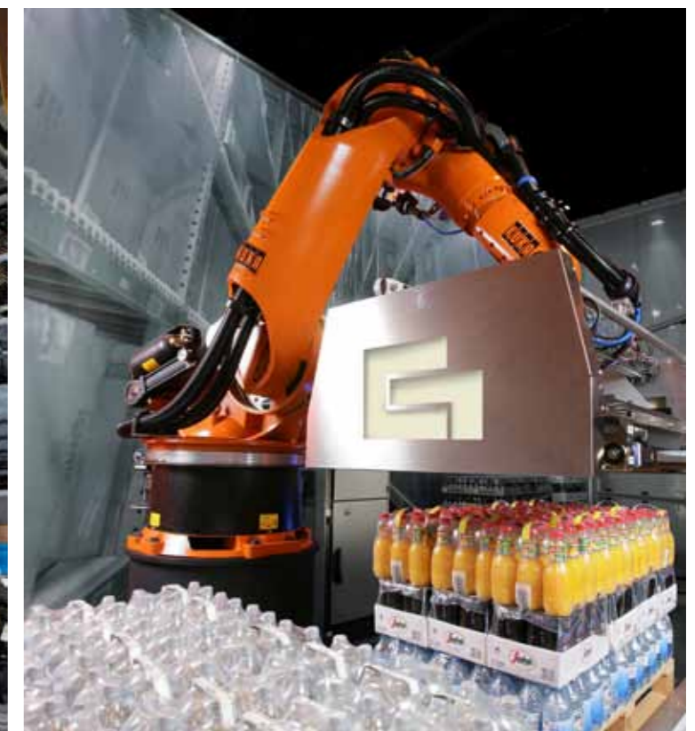
Im Bereich der Intralogistik werden mit Grenzebach Robotic Gepäckstücke automatisch verladen (Bild 1) sowie Paletten optimal be- und entladen (Bild 2).